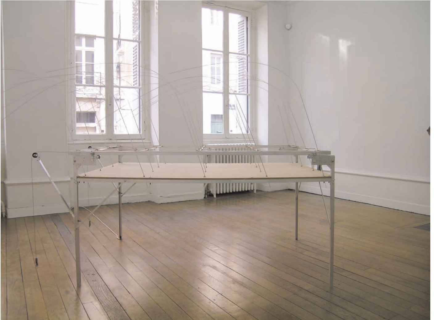
Table des vents