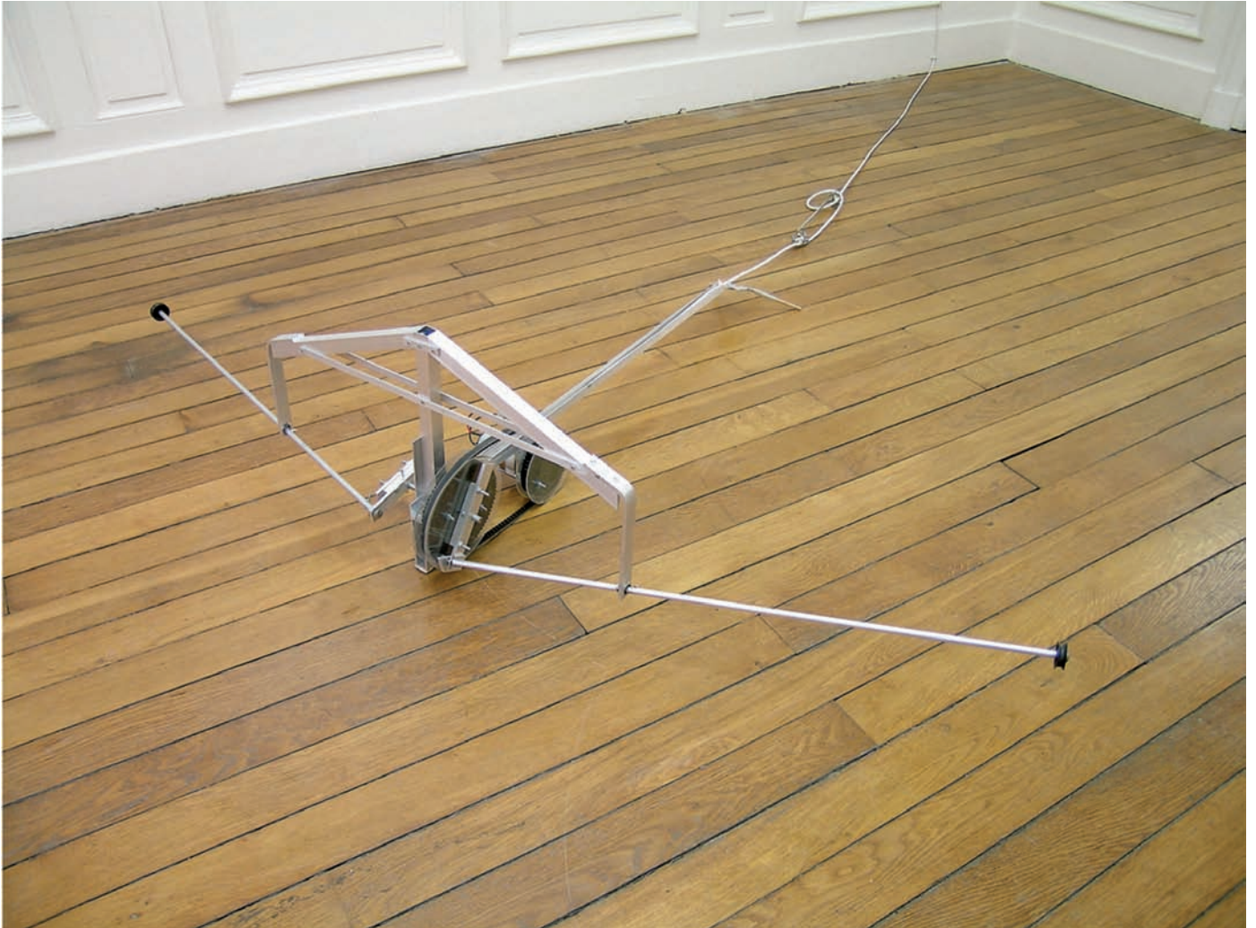
Tortue 2005 aluminium, moteur, bois, PVC 30 x 60 x 100 cm