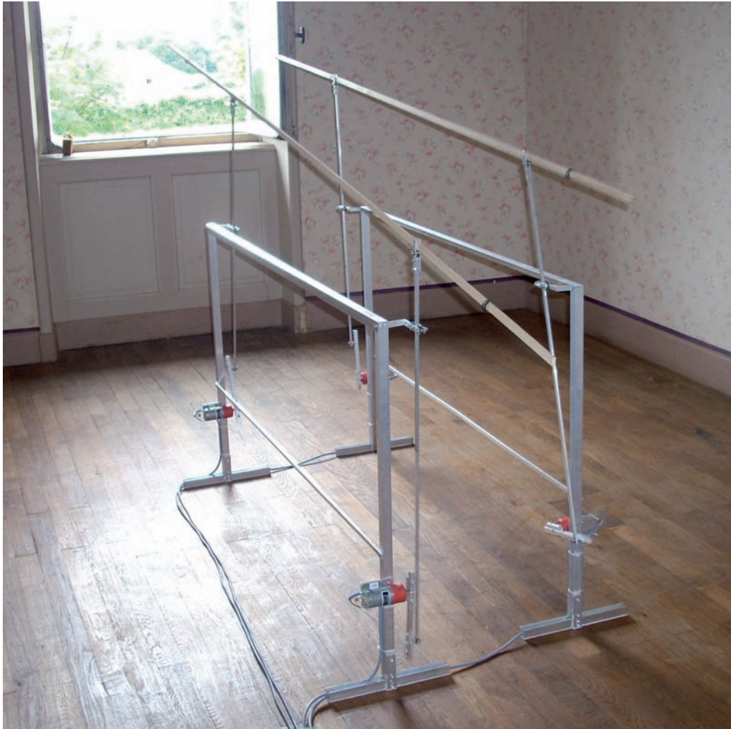
Rodéo 2008 aluminium, moteurs, tiges de balsa 250 x 110 x 160 cm